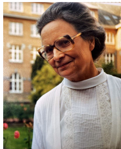
Jubilé de 50 ans de vie religieuse