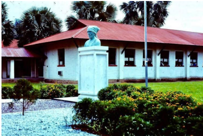
Hôpital Mama Yemo en 1973