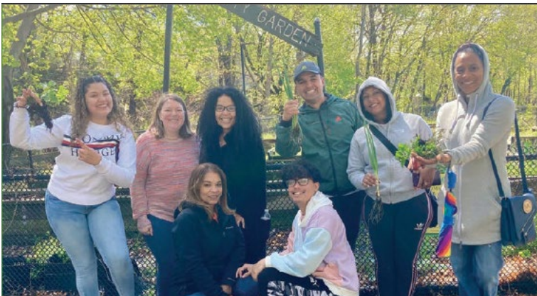
Etudiants et professeurs du centre éducationnel (Lawrence, MA), engagés ensemble dans un service communautaire

Bien que chaque école et ministère de Notre-Dame de Namur soit unique et réponde aux besoins de son contexte social et de son lieu d'implantation, les caractéristiques constituent un fil conducteur qui lie les écoles et les ministères de Notre-Dame de Namur. Nous sommes tous liés les uns aux autres.