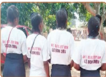
L'éducation au sujet de la Mission et du charisme de Ste Julie billiart fait partie du programme éducatif

A la fin de leur dernière 3 ème année, elles présentent et défendent les travaux de leur apprentissage, surtout en coupe et couture, devant un jury qui les interroge aussi sur tout ce qu'elles ont appris durant les 3 années de formation, et qui délivre un certificat de réussite à celles qui le méritent.