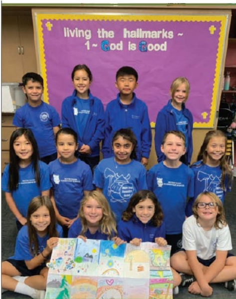
L'école élémentaire Notre-Dame (Belmont, CA) qui célèbre les Caractéristiques

Les bureaux de parrainage de la Province des Etats-Unis Est-Ouest et de la Province de l'Ohio ont mené un processus de discernement d'un an pour rafraîchir et réaffirmer les 7 caractéristiques d'une communauté d'apprentissage Notre-Dame.