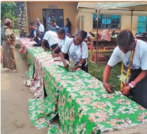
Des jeunes femmes apprennent à préparer, définir et couper le tissu pour en faire des vêtements

Dans nos centres, les jeunes filles apprennent l'alphabétisation, reçoivent des cours ménagers et aussi quelques notions élémentaires de français et calcul ; à cela s'ajoutent la coupe et couture qui sont la formation primordiale qui attire et pousse les jeunes filles à s'inscrire aux centres féminins.