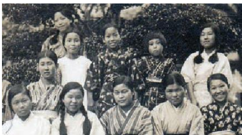
Jeunes élèves des Sœurs

ensuite emprisonnées dans un camp d'internement japonais hostile. Les règles étaient strictes : conversations en japonais, interdiction de sortir ou d'avoir des contacts avec les habitants de la ville ; cependant le directeur du camp était bienveillant. Un lieu de culte fut mis en place, et les Sœurs pouvaient assister à la messe tous les matins ; elles pouvaient sortir de temps en temps pour admirer les cerisiers en fleurs.