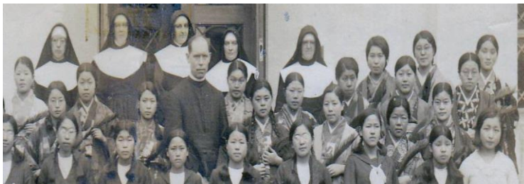
Groupe d'étudiantes à la fin des années 1920 à Okayama

Le Japon et les États-Unis entrent en guerre en décembre 1941 . L'école, dirigée par les Sœurs américaines, subit un impact majeur lorsque les Sœurs sont assignées à résidence dans un couvent pour être