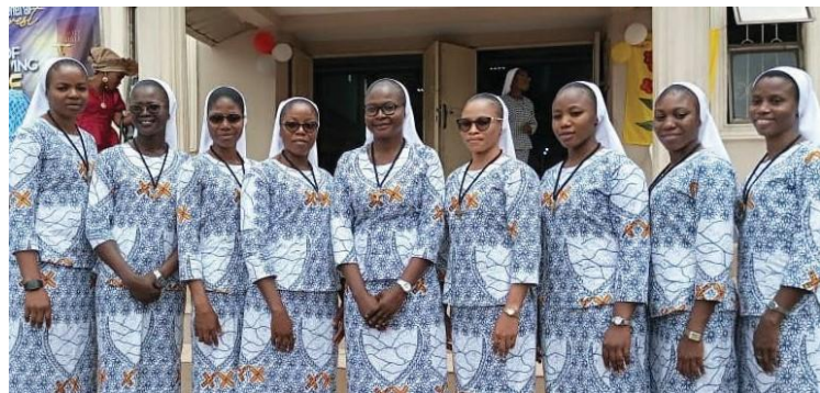
Plusieurs Sœurs font leurs vœux provisoires à l'Eglise St Philip Neri de Jattu

En 1980 , la Congrégation invita et accueillit des jeunes femmes nigérianes afin qu'elles deviennent SNDdeN. D'autres femmes nigérianes suivirent dans les années suivantes. Nos communautés ont grandi et nos Ministères se sont étendus faisant de la formation et de