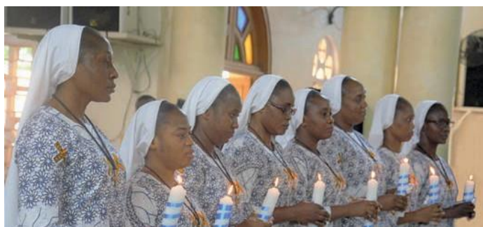
8 Sœurs font leurs vœux perpétuels à la Cathédrale